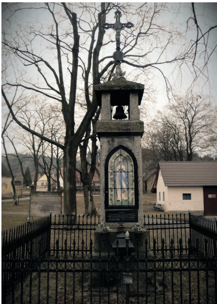
Pomník v Křešicích

Porovnáním vězeňských čísel v dochovaných exhumačních protokolech nebo v kronikách se zpřístupněnými databázemi vězňů koncentračních táborů a jejich poboček (zde je zřetelným příkladem památník KT Flossenbürg) se mi při výzkumu podařilo vrátit identitu několika desítkám obětí. Samozřejmě nikoliv se sto-procentní jistotou, protože vězeňský oděv s číslem na sobě v době smrti mohl mít někdo jiný, než komu byl původně přidělen – v každém případě ale snad pro řadu pozůstalých může být zjištění alespoň přibližného místa skonu jejich blízkého i po tolika letech alespoň částečnou úlevou.