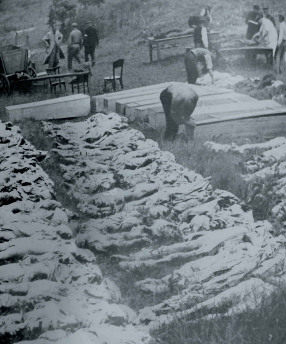
Exhumace v Kašticích

Pátého května přijel na nádraží do Lovosic transport smrti. Zde ho zřejmě opustili strážníci. Skutečnost, že tento transport z KT Johanngeorgenstadt skončil svoji cestu v Lovosicích, potvrzuje i komentář v dobovém filmovém týdeníku Tyden ve filmu 1945 , č. 6. Z 822 vězňů jich přežilo 28. Ti se nejspíš vydali pěšky do Terezína, který byl od 6. května pod správou Červeného kříže. Je pravděpodobné, že většina z vězňů, kteří přežili transport, v Terezíně i přes lékařskou péči zemřela na tyfus nebo celkové vyčerpání. Jedním z nich byl i francouzský básník Robert Desnos.