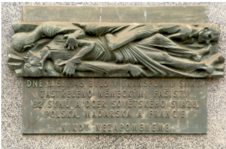
Pamětní deska na nádraží v Olbramovicích

Mnou sledovaný transport byl zřejmě třetí, který Olbramovicemi projížděl.