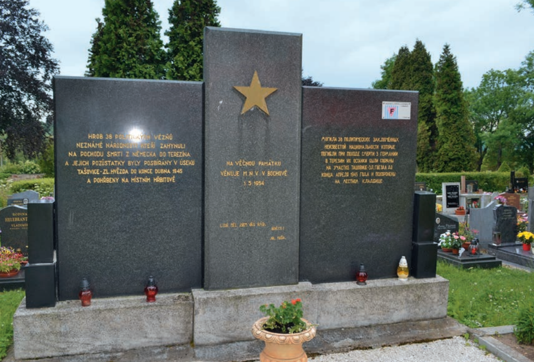
Památník na hřbitově v Bochově

jeden pochod a těžko určit, zda pochovaní vězni jsou obětí mnou sledovaného pochodu, nebo pochodu jiného.