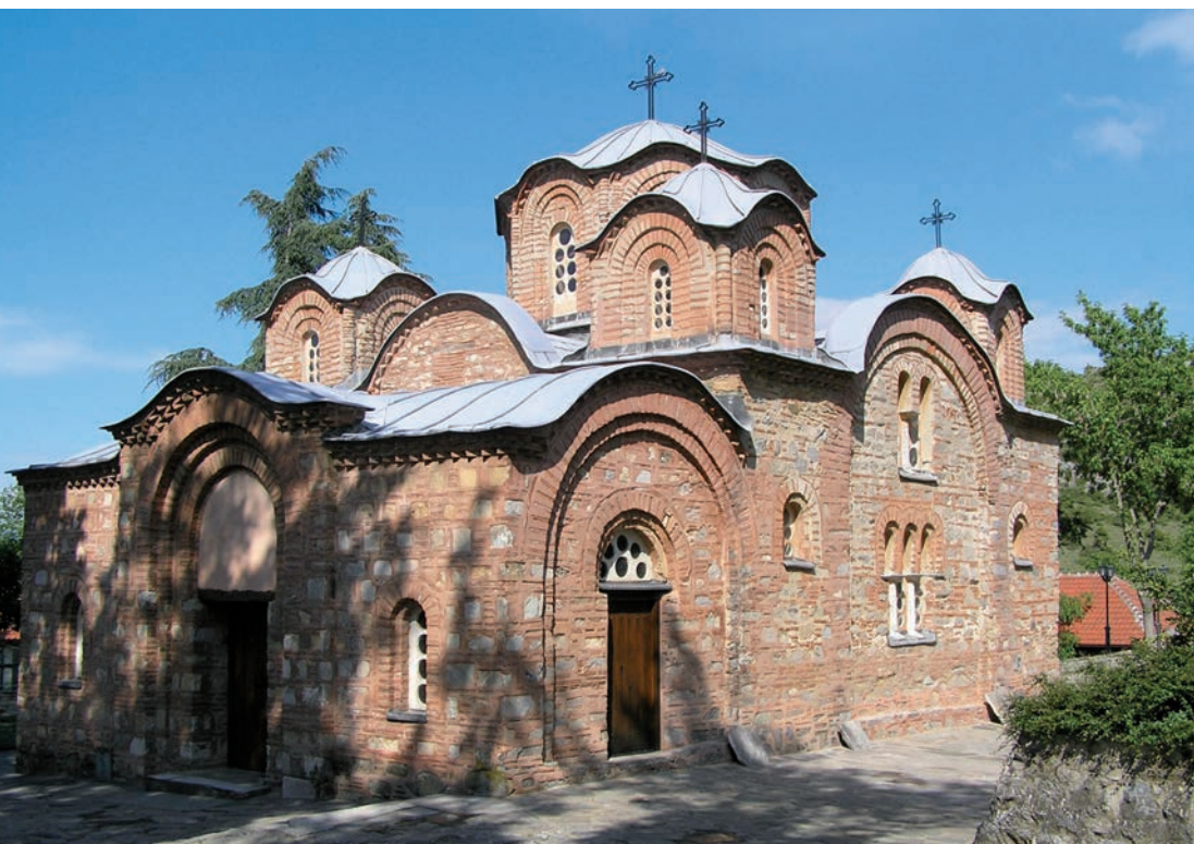
Chrám svatého Pantelejmona v Nerezi, 12. století, vyzdoben freskami 1164, Makedonie