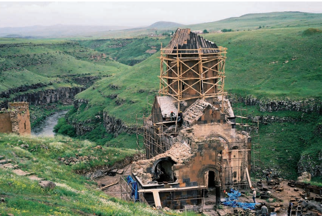
Chrám svatého Řehoře, 1215, Ani