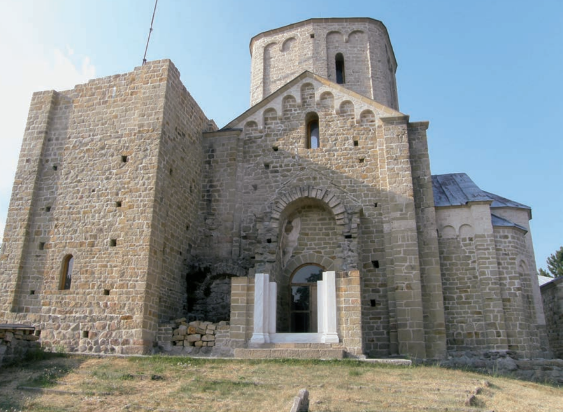
Chrám svatého Jiří v Rase, 1170–1171, Srbsko