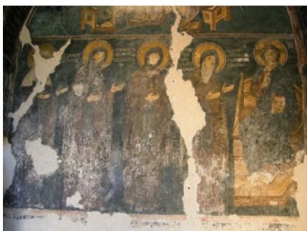
Ktitorská kompozice kapele, 1283