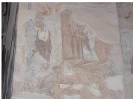
Oběšený Jidáš , freska chrámu svatého Theodora Stratelata, konec 14. století, severní zeď bemaťu