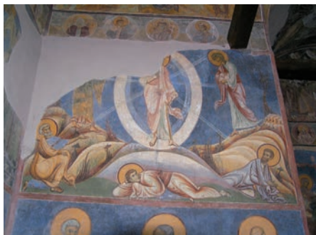
Proměnění Páně , freska chrámu svatého Pantelejmona v Nerezi, 1164