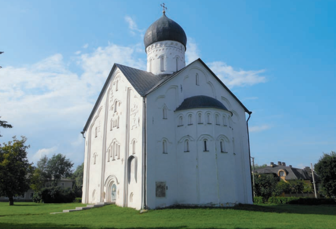
Chrám Proměnění Páně v Iljinově ulici, 1374–1378, Novgorod

Bohorodičky na Volotovově poli (vyzdoben freskami zřejmě řeckým malířem v r. 1363, zcela zničen za druhé světové války, dnes je znovu postaven). Ke zmíněné řadě kompozic patří evangelisté, praotci, Bohorodička v apsidě, výjevy Eucharistie , Sestoupení do pekel , Narození Krista , Zvěstování Bohorodičky atd. Ve výzdobě těchto kostelů jsou si podobné též četné ornamenty. Soudobý výzkum T. Carevské potvrzuje značnou podobu ikonografického programu a ikonografických schémat těchto dvou kostelů.