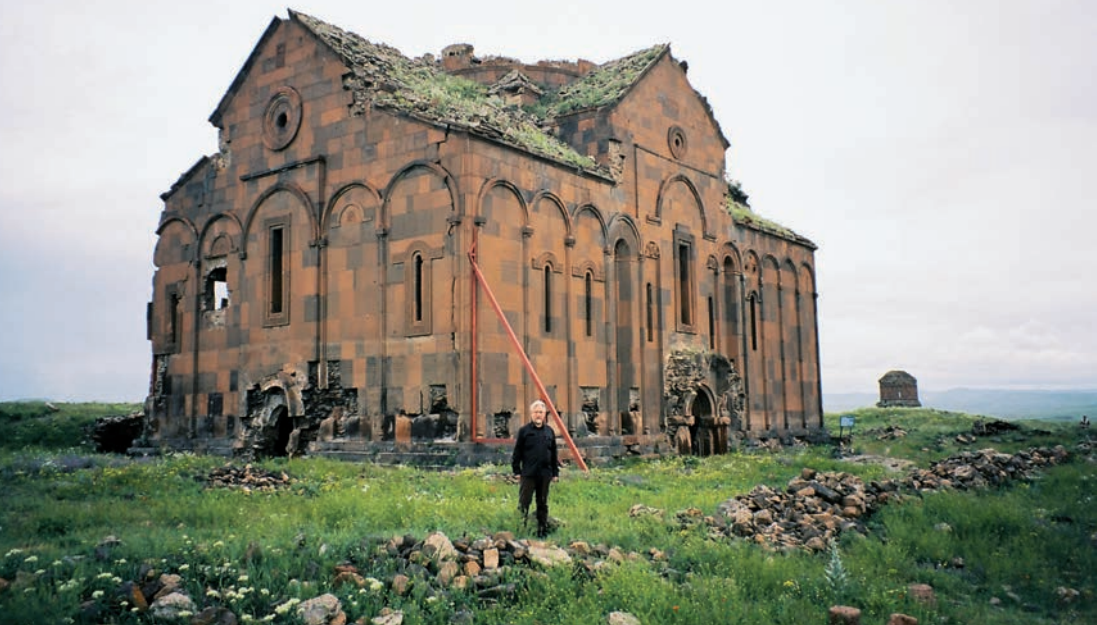
Katedrální chrám v Ani (989–1001)

kurdské dynastie Šeddadidů, která byla v příbuzenském vztahu s Bagratovci. V 15. století se z města stala vesnice, která postupně ztrácela obyvatelstvo; od 16. století dodnes je to mrtvá chátrající památka někdejší kultury, již delší dobu používaná jako kvalitní pastvina.