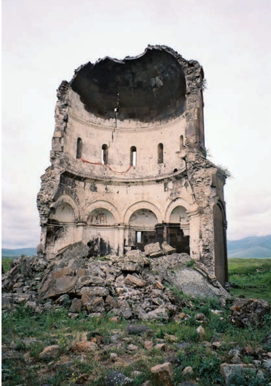
Chrám Spasitele (1035-1036), Ani