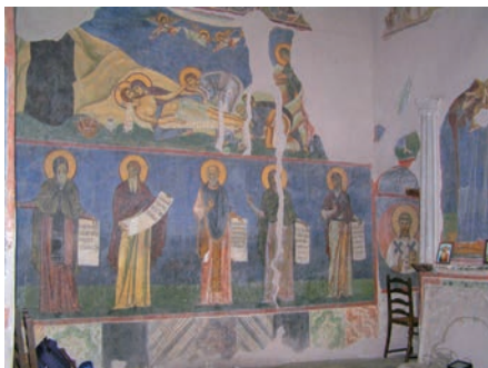
Oplakávání , freska chrámu svatého Pantelejmona v Nerezi, 1164

výjevy ze života Krista a Bohorodičky, v dolním jednotlivé postavy svatých, k nimž patří převážně bojovníci a mniši.