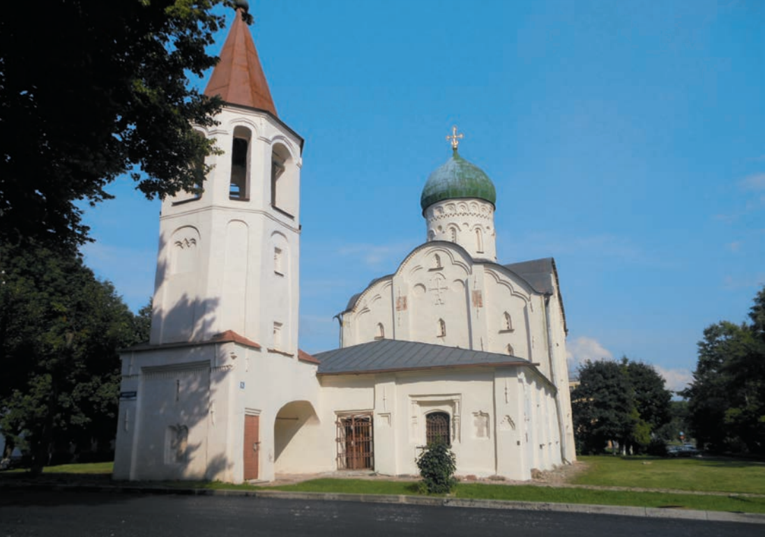
Chrám svatého Theodora Stratelata, 1360-1361, Novgorod

směr tehdejšího výzkumu a určovaly jeho hranice. Dodejme, že se jednalo o období objevování staroruského umění, které se teprve začínalo podrobovat vědeckému výzkumu v dnešním smyslu tohoto slova. Výzkum spočíval ve vyhledávání a zkoumání nových památek. Hranice byly chápány geograficky a byly v duchu doby pojaty široce, zahrnovaly území veškeré byzantské ekumeny.