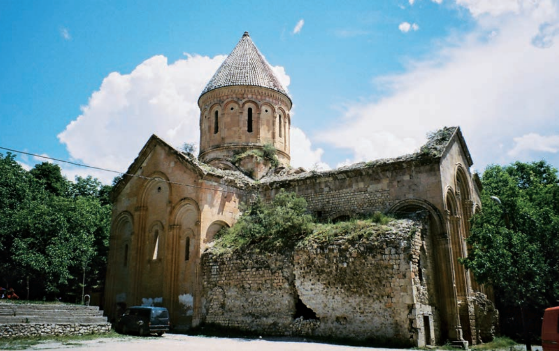
Chrám v Išchaně, 7.-11. století, Turecko