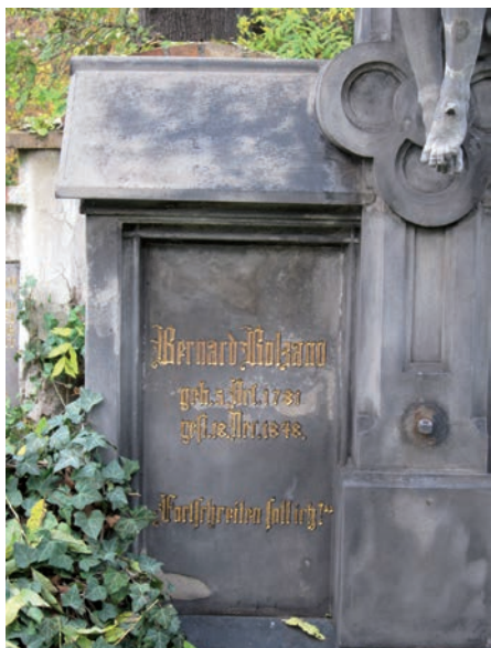
Nápis na Bolzanově hrobě