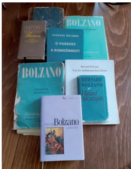
Některá Bolzanova díla

Bolzanovo logické dílo se ocenění nakonec přece dočkalo, trvalo to však nějakou dobu. Takto referuje o Vědosloví Husserl ve svých Logických zkoumáních (1901): „Zatímco se Lange tak vřele přimlouval za ideu čisté formální logiky, neměl ani tušení, že se tato idea už v poměrně vysoké míře realizovala. Nemám přirozeně na mysli četné výklady formální logiky (...), ale Vědosloví Bernarda Bolzana z r. 1837, dílo, jež pokud jde o logickou ‚elementární nauku‘ daleko předstihuje všechno, co ve světové literatuře představuje systematické nárysy logiky. Bolzano sice výslovně nepojednal a nezasazoval se o samostatné vydělení čisté logiky v našem smyslu,