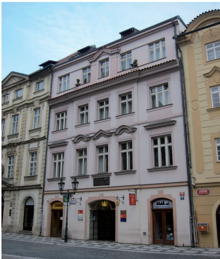
Dům v Celetné ulici, ve kterém rodina Bolzanových žila od roku 1786