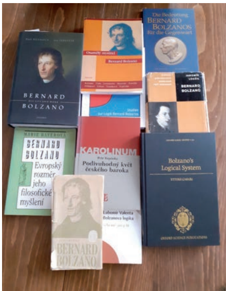
Ukázka bolzanovské literatury

Bolzano užívá v rámci své koncepce písmenné označení pro proměnné představy o sobě a jejich roli a užití dále precizuje a ujasňuje. Využívá také pojmu proměnné představy i pro jiné než čistě logické účely. Pro logiku jsou v zásadě zajímavé ty