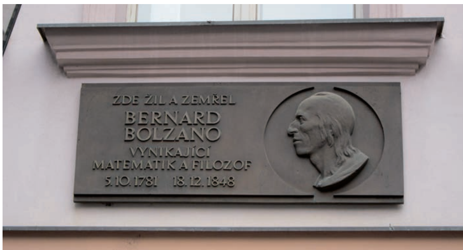
Pamětní deska na domě Bolzanových v Celetné ulici